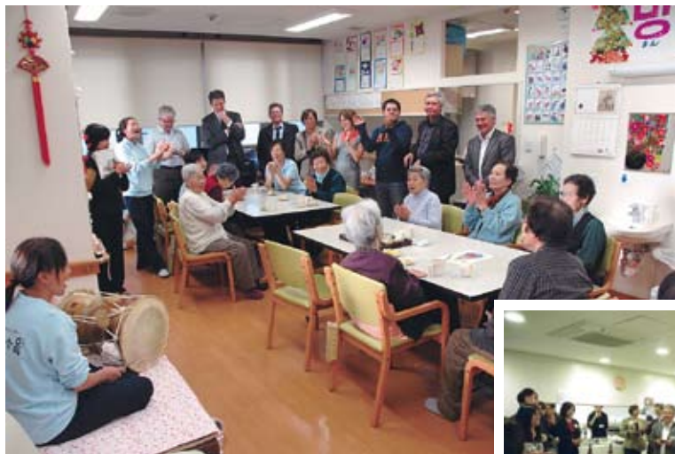
⑫ Visit to Kobe Foreigners Friendship Center run by Kobe Foreigners Friendship Center NPO法人定住外国人支援センター運営の デイサービスセンター「ハナの会」訪問