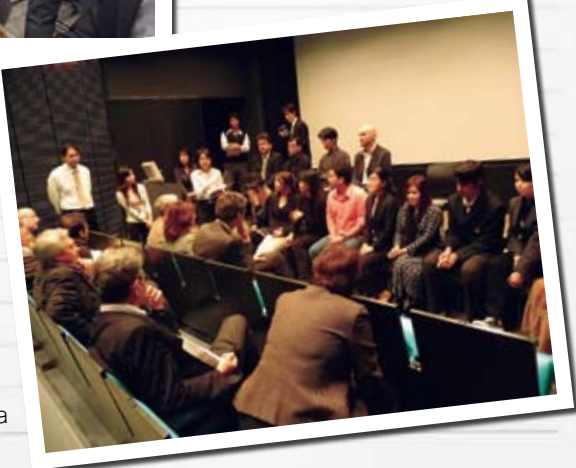
⑦ Visit to Kani Public Arts Centre ala 可児市文化創造センター (ala) 訪問