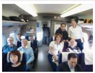
⑯ Traveling by Shinkansen bullet train 新幹線での移動