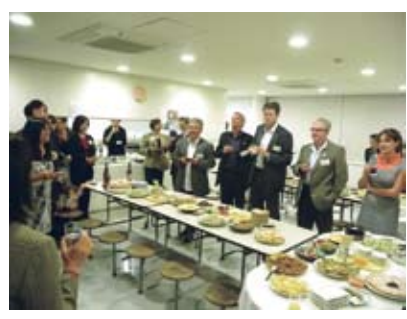
⑬ Visit to Takatori Community Center たかとりコミュニティセンター訪問