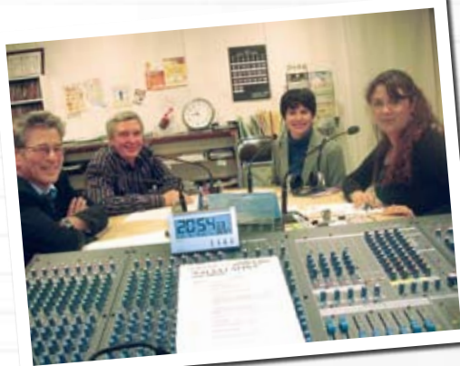
⑭ An impromptu appearance on a FM broadcast at the Center FM 番組 (FM わいわい) への生出演