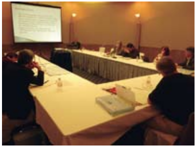
①Orientation Session オリエンテーション