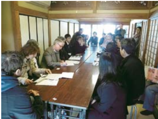
⑩ Exchange with Mr. Naoyoshi Watanabe, the Mayor of Minokamo City, and members of Brazilian Friendship Society in Minokamo city 渡辺直由美濃加茂市長やブラジル友の会 メンバーとの意見交換