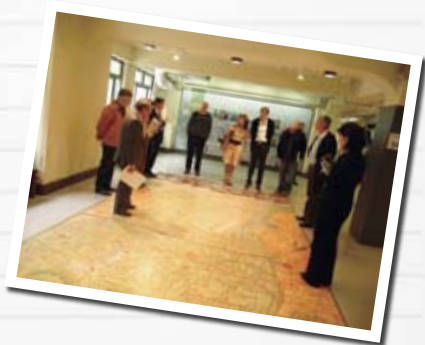
⑮ Visit to Kobe Centre for Overseas Migration and Cultural Interaction 海外移住と文化の交流センター訪問