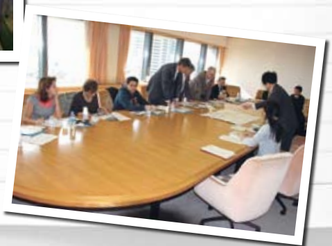
⑪ Visit to Kobe municipal office 神戸市役所訪問