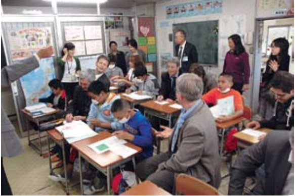
⑤⑥ Visit to Bara classroom in Kani, a school for non-Japanese- speaking children 外国人児童対象適応指導教室 「バラ教室」見学