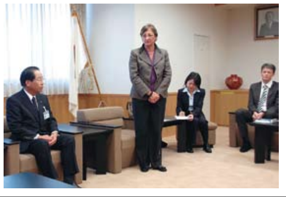
④Visit to Kani Multicultural Centre FREVIA 可見市多文化共生センター「フレビア」訪問