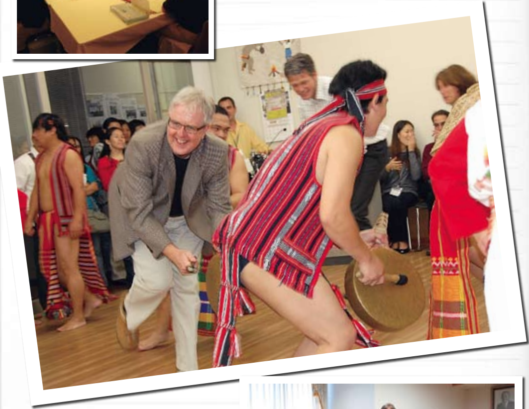
②The Festival of Multicultural Symbiosis in Kani city 可見市多文化共生フェスティバル