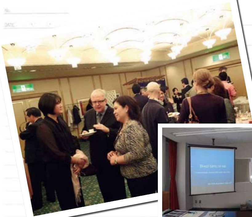
⑧ Welcome Reception レセプション